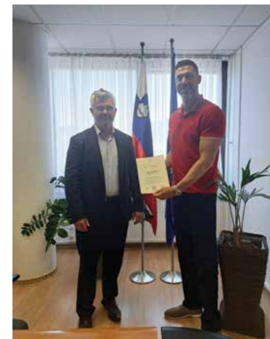
Hvala vsem navijačem za podporo v Sarajevu.