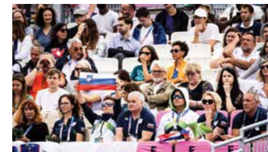
Parašportnike je na igrah podprl tudi minister Luka Mesec.

Za naše parašportnice in parašportnike je navijala mag. Urška Klakočar Zupančič, predsednica Državnega zbora Slovenije.