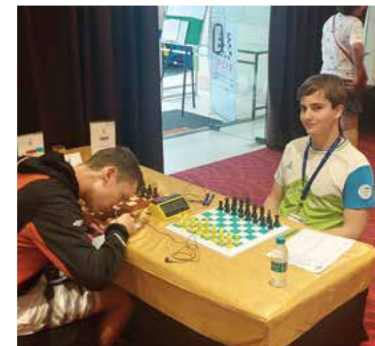
Šah ima preprosto rad.

Prvič je na taki mednarodni sceni tekmoval že v Franciji, zdaj v Indiji.