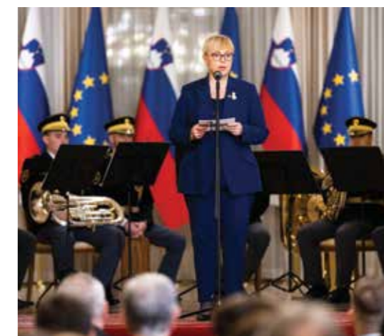
V predsedniški palači.

Zbrane je nagovorila dr. Nataša Pirc Musar, predsednica Republike Slovenije.