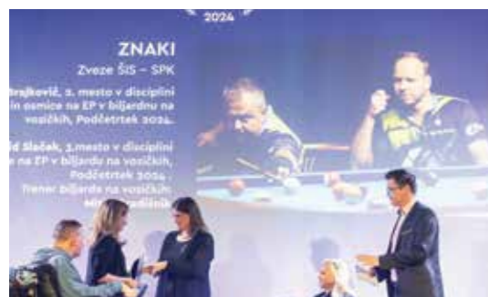
Slovenski bilijard kotira v Evropi zelo visoko.